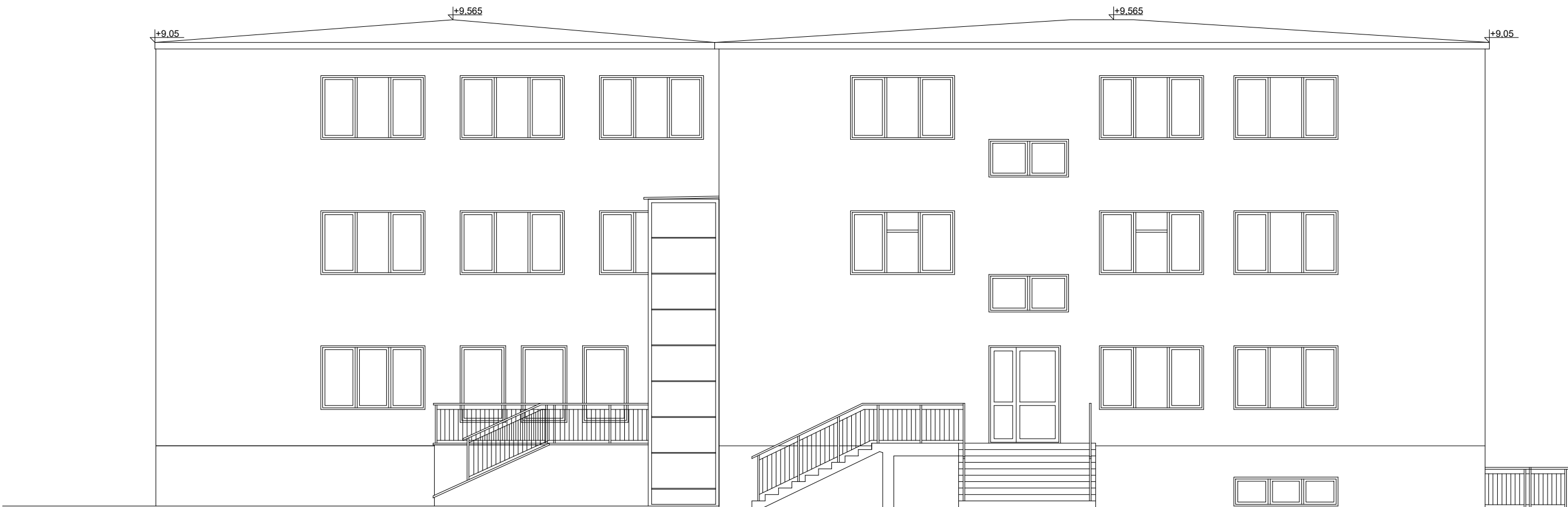
Elewacja boczna - północna